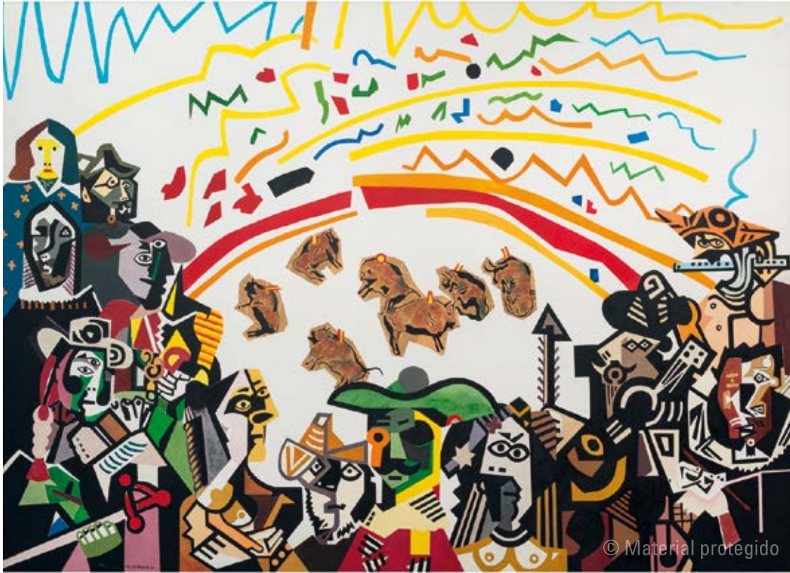
21. Equipo Crónica Ruedo ibérico , 1981 Serie Crónica de la transición Óleo y collage sobre lienzo 170 x 240 cm Colección privada

exposición de mayo en la galería Maeght. El texto que acabo de citar fue escrito para poner al día la secuencia de textos explicativos en el catálogo de la retrospectiva que finalmente no tuvo lugar. Ignoro por qué no se publicó en el catálogo de la muestra que el Ministerio hizo en noviembre.