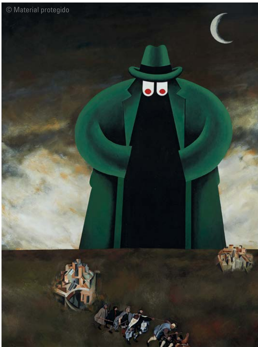
19. Equipo Crónica El coloso del miedo , 1977 Serie A modo de parábola Acrílico sobre lienzo. 200 x 150 cm Patrimonio histórico-artístico del Senado N.º inv. 164