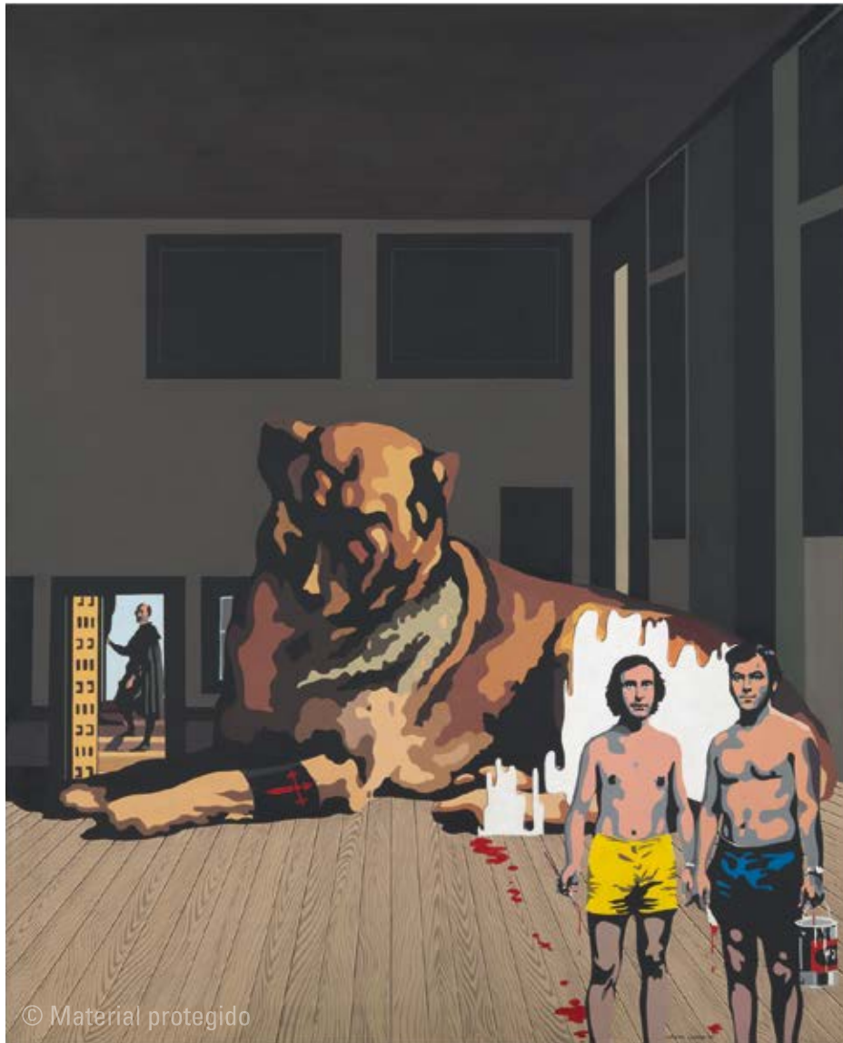
9. Equipo Crónica Autorretrato en palacio o El perro , 1970 Serie Autopsia de un oficio Acrílico sobre lienzo 122 x 100 cm Colección Arte Siglo XX. MACA, Museo de Arte Contemporáneo de Alicante N.º inv. XX.044