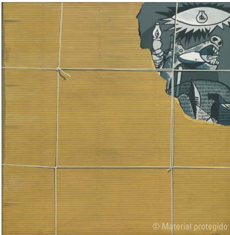
8. Equipo Crónica El embalaje , 1969 Serie Guernica 69 Acrílico sobre lienzo 120 x 120 cm Colección de arte contemporáneo Fundación "la Caixa" N.º inv. ACF0147

España un régimen republicano. Para que la idea fuera posible hacía falta, naturalmente, el consentimiento personal de Franco. Inesperadamente el dictador lo dio, de modo que a finales de 1968 el director general de Bellas Artes, Florentino Pérez Embid, recibió la orden de iniciar las gestiones pertinentes para conseguir la recuperación de la obra maestra de Picasso. Aunque el asunto fue tratado inicialmente con discreción, no podía dejar de trascender y a lo largo de 1969 se convirtió en uno de los principales temas de comentario del mundo artístico español 3 .