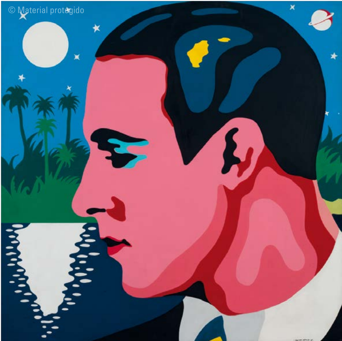
6. Equipo Crónica Latin lover , 1967 Acrílico sobre lienzo 120 x 120 cm Colección privada