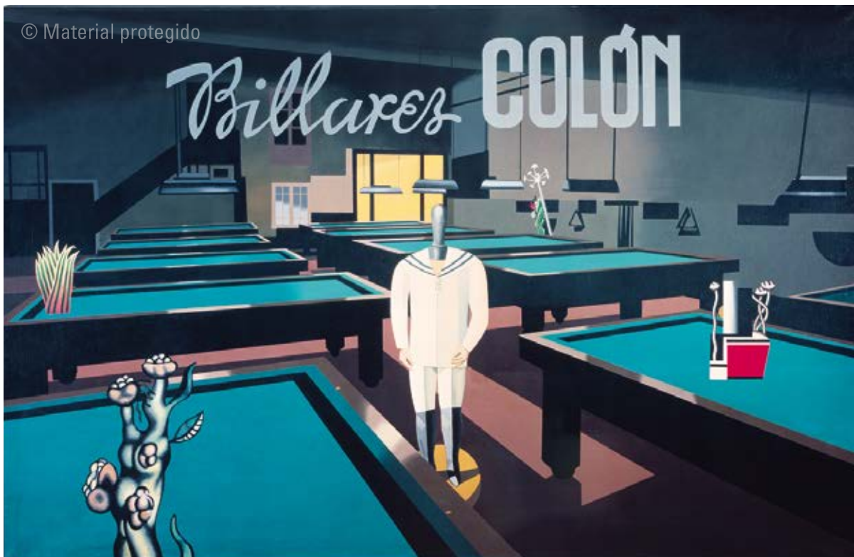
18. Equipo Crónica El bosque maravilloso , 1977 Serie El billar Acrílico sobre lienzo 175 x 275 cm Colección Arango

vehículo de la metáfora era el desfase histórico, la inadaptación al mundo moderno; y esa inadaptación el billar la compartía, no con la sociedad en general, sino sólo con la pintura.