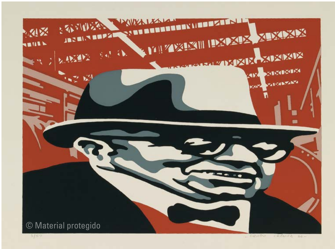
5. Equipo Crónica El industrial , 1966 Serigrafía sobre papel Edición 6/50 39,5 x 54,9 cm (papel); 23,7 x 32,9 cm (huella) Colección privada

En la carpeta hay una serigrafía titulada El industrial [fig. 5] en la que puede verse un enfoque nuevo en el trabajo del Equipo. La imagen del primer término, distorsionada horizontalmente, parece derivada de la fotografía de carnet de un hombre de edad avanzada, vestido formalmente con pajarita y sombrero. Además de distorsionada, está simplificada, limitada al blanco y negro con un gris intermedio. Detrás de esa cabeza, que ocupa la totalidad del ancho de la serigrafía, se ve, como fondo, la fotografía del interior de una enorme nave industrial, reducida a blanco y rojo. La combinación, claramente artificiosa, de estas dos imágenes se refiere, evidentemente, a un tipo social, algo que permite relacionarla con el realismo preconizado por Lukács. Entre 1966 y 1967 el Equipo explorará el camino de la tipificación lukácsiana en un grupo pequeño, pero significativo, de obras. El ejemplo más brillante es Latin lover de 1967 [fig. 6], un cuadro de tamaño mediano y de extraordinario impacto visual que incluimos aquí como culminación del periodo inicial de la trayectoria de Equipo Crónica.