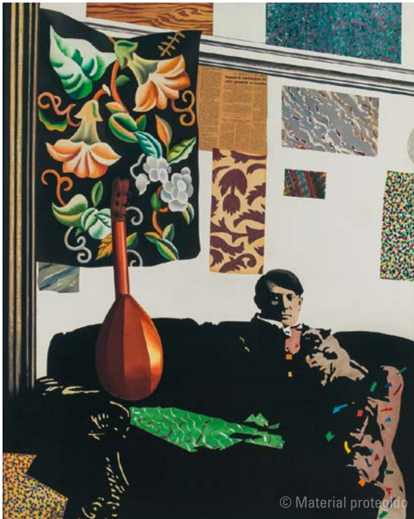
20. Equipo Crónica La fotografía o El personaje , 1980 Serie Crónica de la transición Óleo, collage y acrílico sobre lienzo. 160 x 130 cm Museo de Bellas Artes de Bilbao N.º inv. 87/31

de su redacción. Crónica de la transición se presentó en la galería Maeght de Barcelona en mayo de 1981, en una amplia exposición que incluía también obras de las dos series anteriores. En el catálogo se publicaban textos de Valeriano Bozal, de José Francisco Yvars y del autor de este escrito, pero ninguno del propio Equipo Crónica. Esta ausencia venía a interrumpir la secuencia de textos explicativos sobre sus series que el Equipo había venido redactando prácticamente desde el comienzo de su andadura. El último había sido uno dedicado a los cartones de la serie Paisajes urbanos , publicado en el catálogo de la exposición de la galería Maeght de Zúrich en octubre de 1979. En el verano de 1981, por tanto, las últimas dos series carecían de texto explicativo. Sin embargo, en el momento de la inauguración de la exposición en Barcelona, o poco después, el Director General de Bellas Artes, Javier Tusell, comunicó al Equipo el deseo del Ministerio de Cultura de organizar una amplia retrospectiva de su obra. Cuando concretó las fechas, octubre de ese mismo año (coincidiendo con el aniversario del nacimiento de Picasso y la prevista llegada del Guernica a España), se vio que el proyecto era irrealizable y la retrospectiva se aplazó. En su lugar el Ministerio organizó, en noviembre de 1981, una exposición en Madrid que recogía las mismas obras y reproducía el catálogo de la