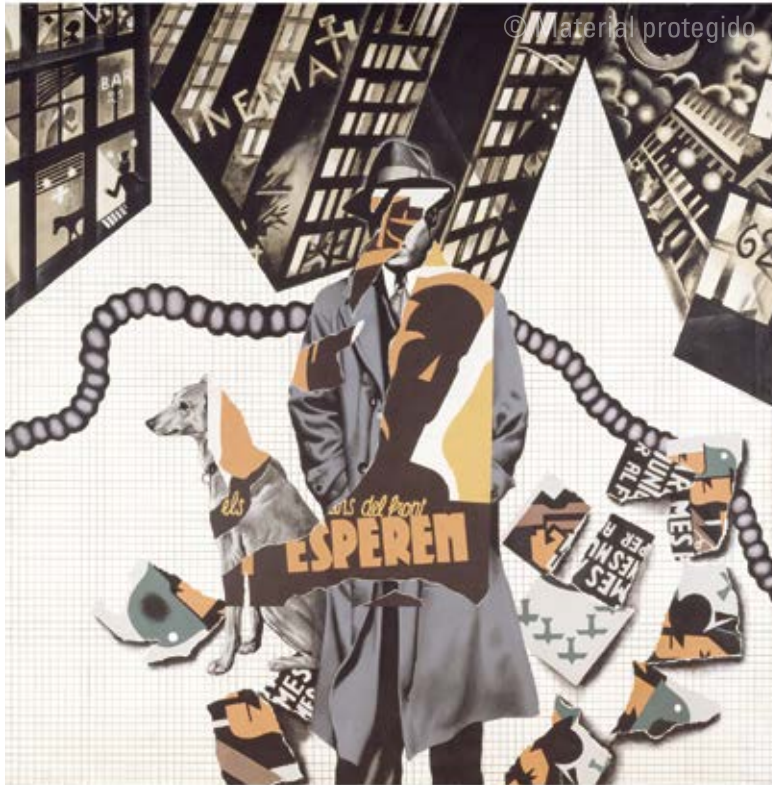
16. Equipo Crónica La calle , 1973 Serie El cartel Acrílico sobre lienzo 200 x 200 cm Colección Guillermo Caballero de Luján Valencia

El cartel fue su respuesta. He aquí cómo lo caracterizaba el Equipo en 1981 21 :