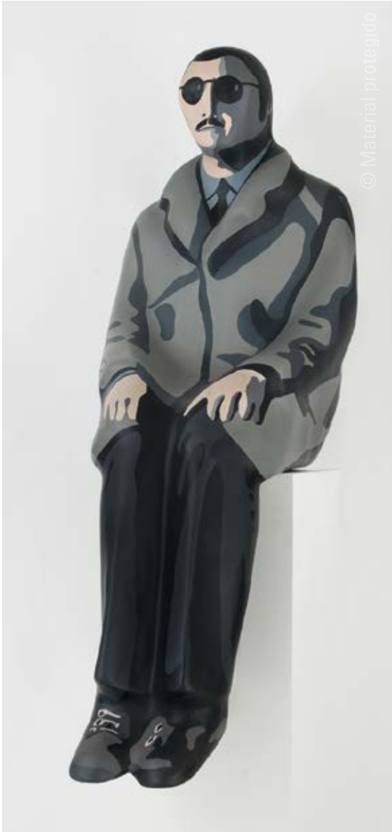
15. Equipo Crónica Espectador de espectadores , 1972 Múltiple hecho para los Encuentros de Pamplona de 1972 Pintura sobre cartón piedra 127 x 49 x 82,5 cm Museo de Bellas Artes de Bilbao N.º inv. 90/47

escasez de foros culturales que se ofrecían en la España de Franco, había que aprovecharlos, aunque su carácter planteaba dudas. Finalmente el Equipo decidió participar, pero con una obra que pusiera en evidencia los problemas políticos implicados en la organización de los Encuentros.