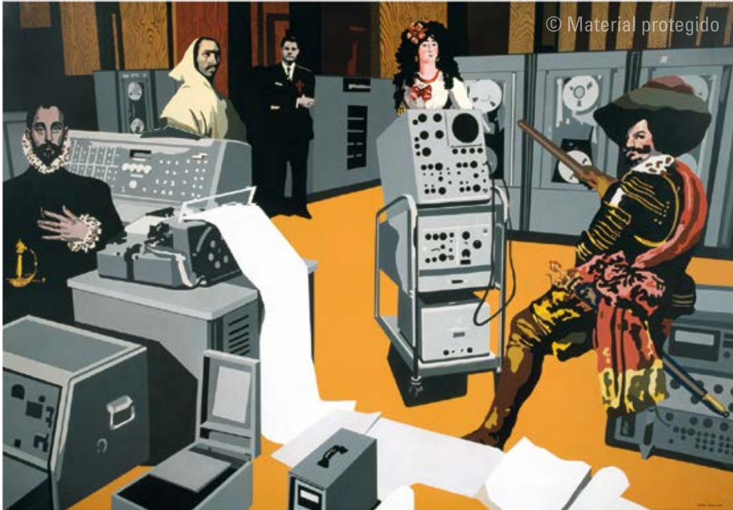
7. Equipo Crónica Las estructuras cambian, las esencias permanecen , 1968 Serie La recuperación Acrílico sobre lienzo 130 x 160 cm Colección Guillermo Caballero de Luján, Valencia

La recuperación es una serie larga. Es la primera y probablemente no fue planeada inicialmente como serie. La homogeneidad e identidad que hoy percibimos en ella surgieron gradualmente conforme iba avanzando su realización a lo largo de 1968. El proceso es interesante precisamente porque fue la primera y porque fue pintando los cuadros adscritos a la misma cuando surgió la decisión de Equipo Crónica de estructurar su trabajo en series.