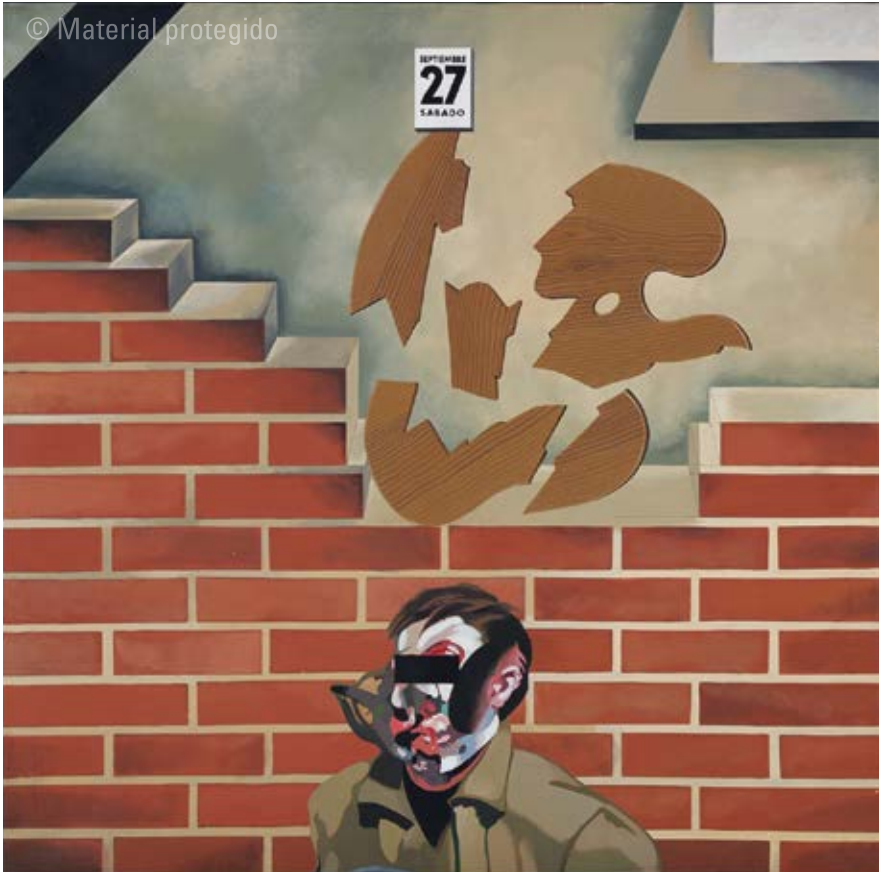
17. Equipo Crónica Paredón III , 1975 Serie El paredón Acrílico sobre lienzo 150 x 150 cm Colección privada

plejidad pictórica, no cabe duda de que es la obra más ambiciosa del Equipo. Quizá no sea la más lograda. El esfuerzo invertido en su realización es demasiado aparente y la impregna de una cierta rigidez que limita el resultado al que el Equipo aspiraba.