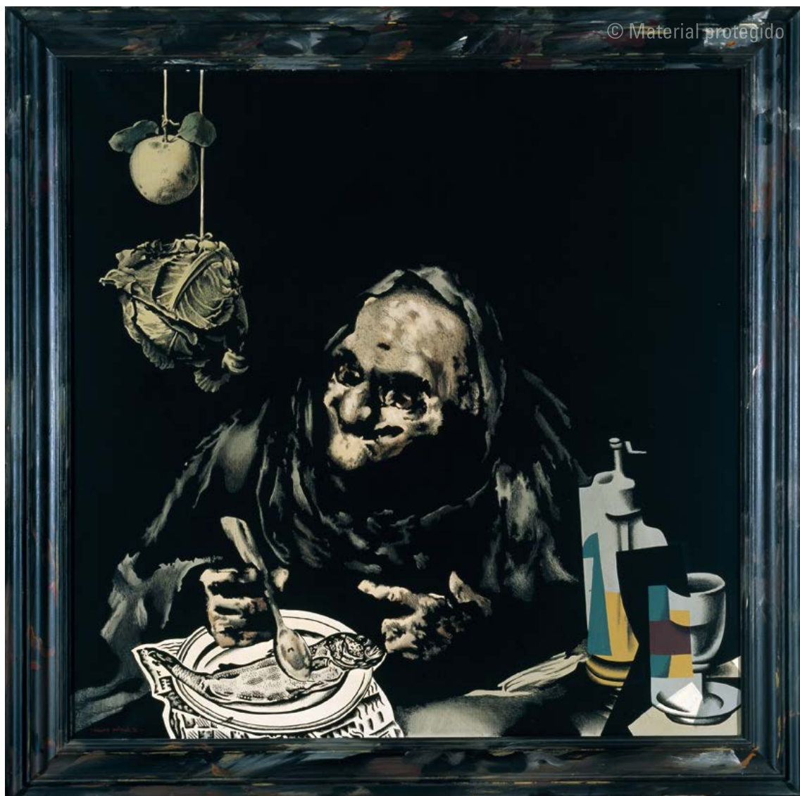
12. Equipo Crónica La comida , 1972 Serie Retratos, bodegones y paisajes Acrílico sobre lienzo y marco 140 x 140 x 6,5 cm Museo Nacional Centro de Arte Reina Sofía, Madrid N.º inv. AD03787

recordando los tiempos de su propia educación en la Escuela de Bellas Artes de San Carlos, donde el retrato, el bodegón y el paisaje se estudiaban, efectivamente, como asignaturas específicas.