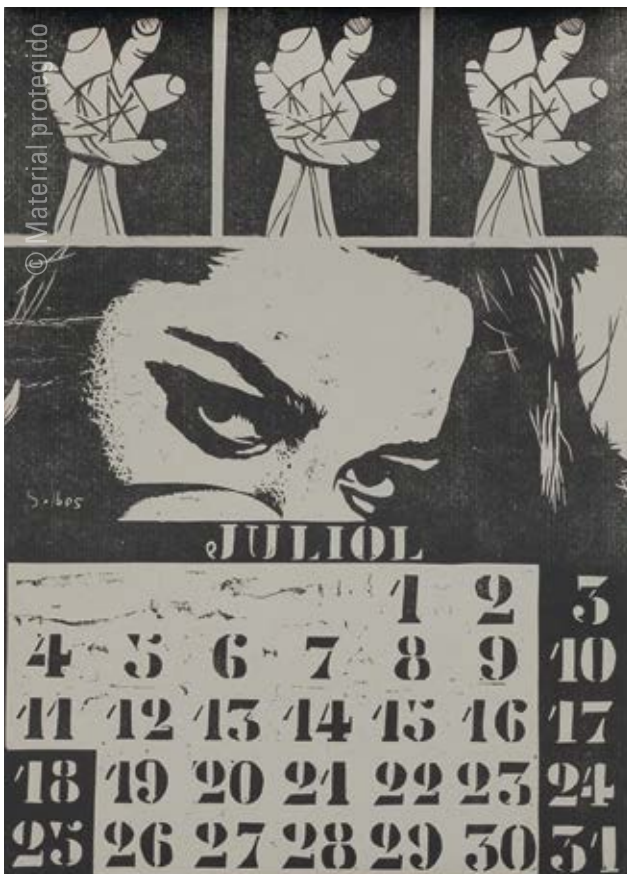
2. Estampa Popular de Valencia Calendario de 1966 (mes de julio) , 1965 Offset sobre papel 44 x 30,8 cm Colección privada