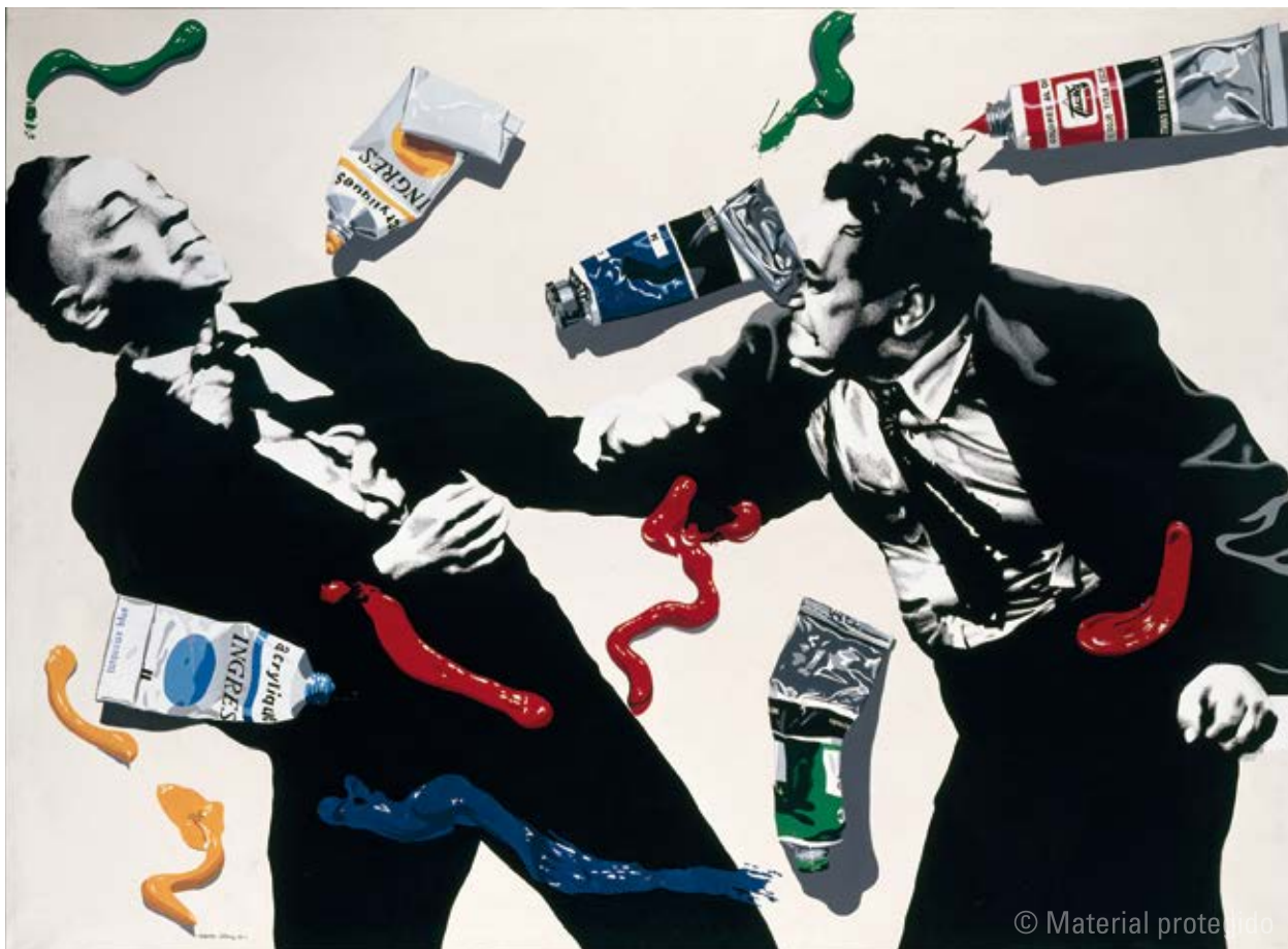
11. Equipo Crónica Pintar es como golpear , 1972 Serie negra Acrílico sobre lienzo 150 x 200 cm Museo Nacional Centro de Arte Reina Sofía, Madrid N.º inv. AD00376