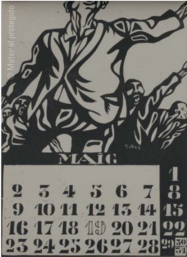
1. Estampa Popular de Valencia Calendario de 1966 (mes de mayo) , 1965 Offset sobre papel 44 x 30,8 cm Colección privada