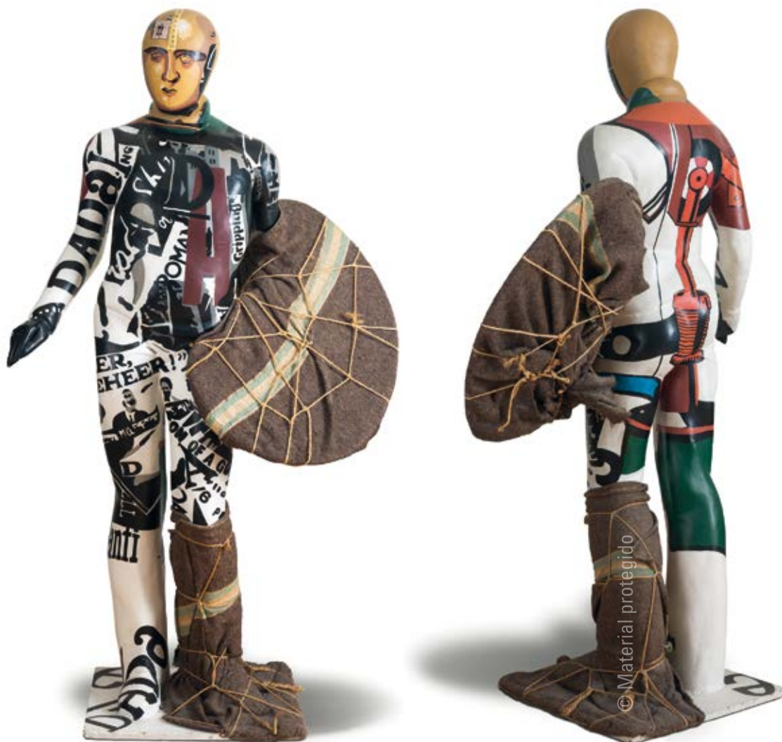
13. Equipo Crónica El pintor , 1973 Serie Oficio y oficientes Pintura sobre cartón piedra 165 x 95 x 54 cm Colección privada

El catálogo de la retrospectiva de Rotterdam incluye quince cuadros de esta serie junto a otros treinta y nueve pertenecientes a series anteriores. Incluye también un múltiple, El pintor [fig. 13]. De él se presentaron en la exposición los veinte ejemplares realizados, pintados cada uno de modo diferente, y colocados en fila, un poco como suelen instalarse los soldados de terracota de Xi'An. Ésta es la obra que hemos elegido (en un solo ejemplar) para representar en esta exposición la serie Oficios y oficientes . He aquí la descripción que el Equipo hace del múltiple: