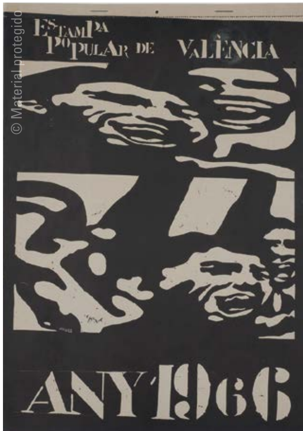
3. Estampa Popular de Valencia Calendario de 1966 (portada) , 1965 Offset sobre papel 44 x 30,8 cm Colección privada