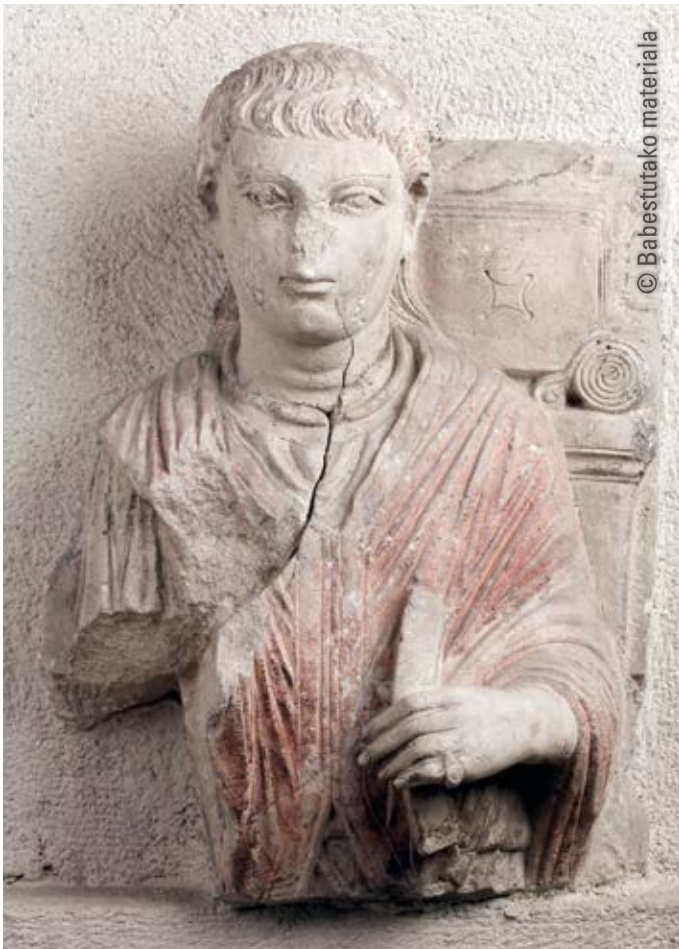
9. Palmirako hilarria , c. 150 Kareharria. 51 cm (altuera) The Istanbul Archaeological Museums Inb. zenb.: 3793