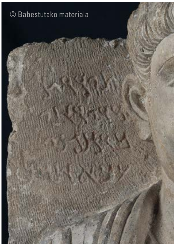
2. Palmirako hilarria Bilboko Arte Ederren Museoa Inb. zenb.: 12/92 Inskripzioaren xehetasuna