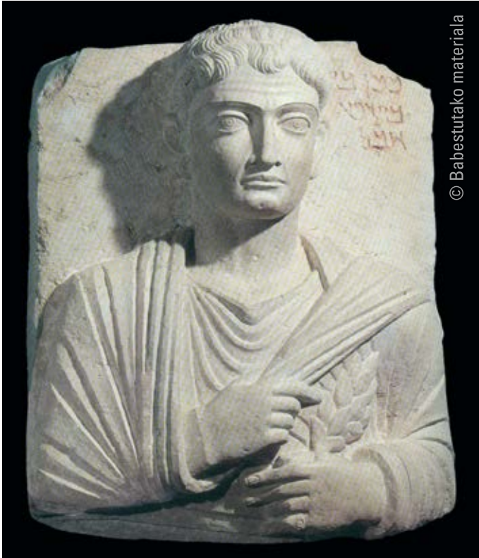
8. Palmirako hilarria , II. mendeko lehen erdia Harria Gaur egun suntsitua. Lehenago Palmirako Museo Nazionalean (Siria)