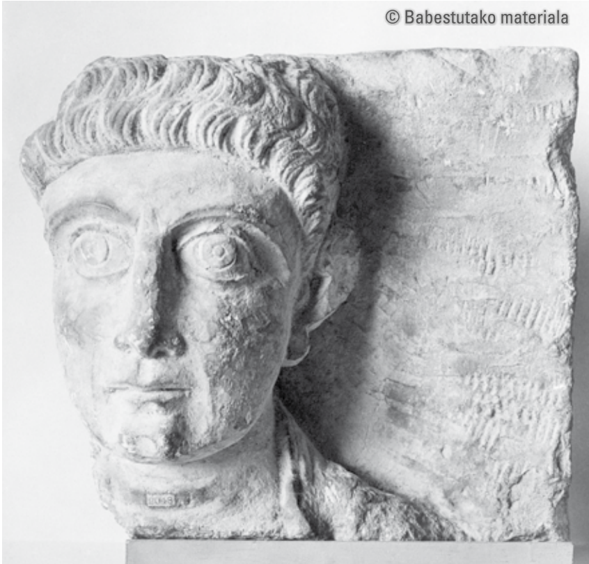
7. Palmirako hileta-erretratu bateko gizonzko baten burua , I. mendeko bigarren erdia-II. mendeko lehen erdia Harria. 26,8 x 24,3 cm The Metropolitan Museum of Art, New York Inb. zenb.: 01.25.7