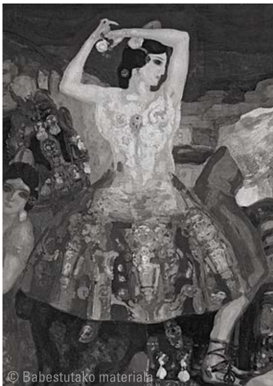
2. Hermen Anglada-Camarasa (1871-1959) Zerra valentziarrak , c. 1907 Olioa mihisean. 70 x 100 cm Bilduma partikularra, Bartzelona Xehetasuna