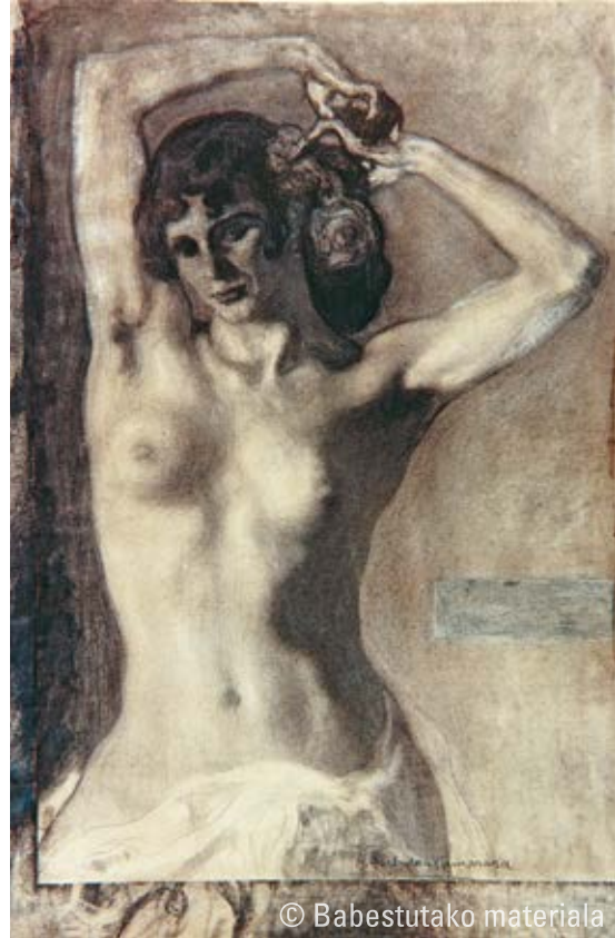
5. Hermen Anglada-Camarasa (1871-1959) Biluzia mahastioaren azpian lana prestatzeko marrazkia, c. 1909 Ikatz-minadun arkatza eta ikatz-ziria, kraft motako paperean (beste paper baten gainean kolatua). 104 x 70,5 cm Col·lecció HAC de la Fundació "la Caixa" Inb. zenb. HACF0721