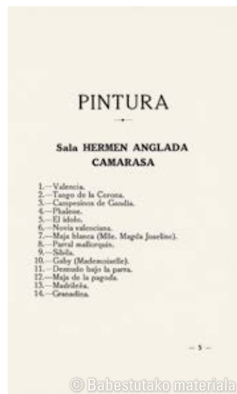
9. Bilboko Nazioarteko Lehenengo Pintura eta Eskultura Erakusketaren katalogoa, 1919 Azala, erakusketa-aretoaren plano eta Anglada-Camarasaren partaidetzari buruzko orrialdea

Sasoi hartan, Angladaren eta Francesc Cambó politikariaren arteko harremana bere unerik gorenean zegoen, eta, horrela, Cambó bere bildumagilerik garrantzitsuenetako bat izatera heldu zen. Sustapen Ministerioan denbora laburrez aritu ostean, Cambó izan zen De la Sota bultzatu zuena margolariari gonbidapena bidal ziezaion –biak ondo konpontzen ziren–, eta, gero, Cambó eta Joan Ventosa i Calvell –Liga Regionalistako beste gizon indartsuenetako bat– beti egon ziren Angladaren partaidetzaren atzealdean eta antolakuntzan. Gustu pertsonaletatik haratago, Cambók, zeinak beti parametro politikoen arabera jokaten baitzuen, oso argi zeukan Anglada-Camarasa zela, margolari katalan bizidunen artean, nazioartean osperik handiena zuena, eta ezaugarri horrekin elkarrekintzan aritzea interesatzen zitzaion.