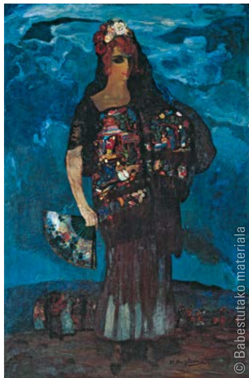
10. Hermen Anglada-Camarasa (1871-1959) Pagodako maja , c. 1913 Olioa mihisean. 205 x 135 cm Col·lecció HAC de la Fundació "la Caixa" Inb. zenb. HACF0798