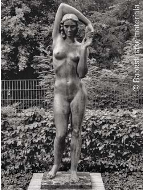
7. Fritz Klimsch (1870-1960) Maja , 1931 Brontzea. 170 cm (altuera) Heimatmuseum Berlin Köpenick

Edozelan ere, 1914an Gerra Handia piztu zen (gero Lehen Mundu Gerra izenarekin ezagutuko zena, alegia), eta horrek modu bortitzean moztu zuen Angladaren ibilbidea, unerik distiratsuenean zegoenean. Margolariak nazionalitate frantziarra zeukan, eta, une hartan, Mallorcan zegoen. Ez zen gehiago Parisera itzuli, etxebizitza eta tailerra han zituen arren. Eta, gatazka hain handia zela ikusita, eta albiste kontraesankorrez betetako garai hartan, espainiar nazionalitatea berreskuratu zuen, Francesc Cambó politikari eta abokatuaren laguntzaz. Anglada Cambóren laguna zen, baina ez ziren joera politiko berekoak; izan ere, Cambó Lliga Regionalista kataluniarraren liderra zen, eta margolaria, berriz, errepublikanismoaren inguruan mugitzen zen.