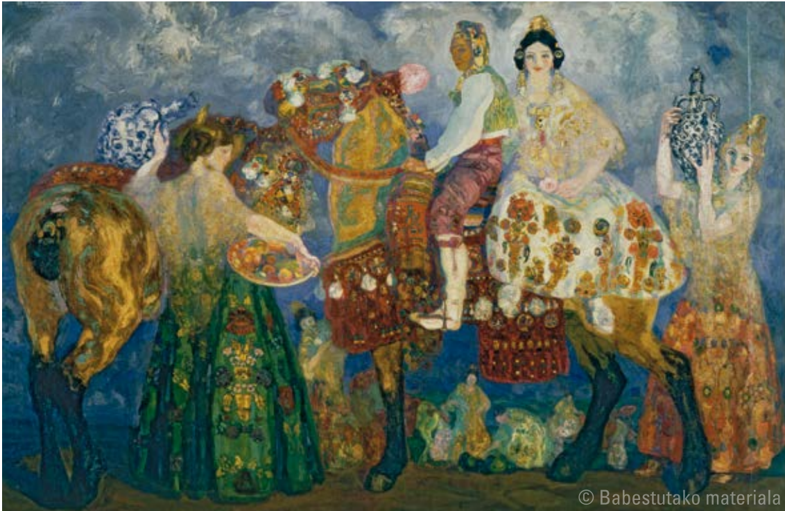
6. Hermen Anglada-Camarasa (1871-1959) Gandíako nekazariak , 1909 Olioa mihisean. 240 x 338 cm Asturiasko Printzerriko gobernua, Masaveu Bilduma Gordailuan Asturiasko Arte Ederren Museoan, Oviedo

kontzeptu kromatikoa, marrazkigintza arloa baino 8 . Erakusketa hartan, Angladak sekulako arrakasta izan zuen, eta Valentzia izeneko olioak –gero Gandíako nekazariak izenarekin ezagutuko zen [6. ir.]– erakusketako Sari Nagusia eskuratu zuen, Ignacio Zuloaga eta Eliseu Meifrènen lan banarekin batera.