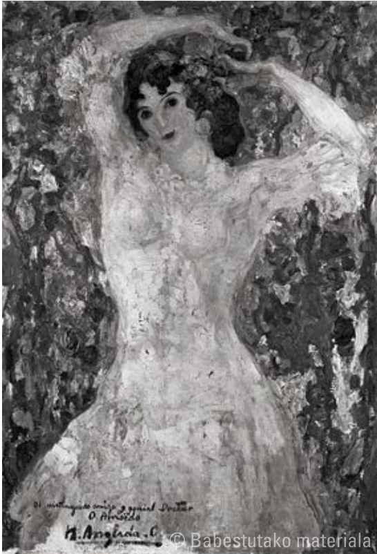
4. Hermen Anglada-Camarasa (1871-1959) Emakume ijitoa , c. 1905-1906 Olioa mihisean. 116 x 81 cm Bilduma partikularra