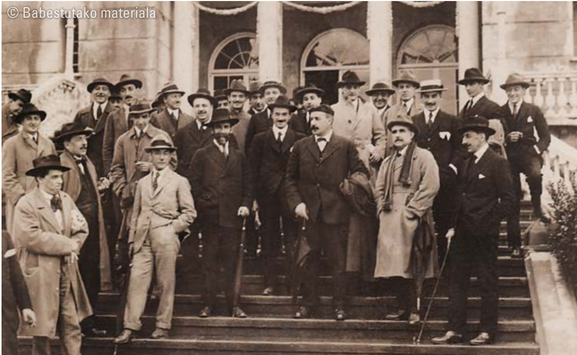
8. Hermen Anglada-Camarasa, Bilboko Nazioarteko Lehenengo Pintura eta Eskultura Erakusketan , 1919

Proiektuak aurrera egin zuen, eta Madrilgo erakusketa 1916ko ekain-uztailean egin zen, Retiroko Arte Ederretako Jauregian, Arte Ederretako Zirkuluak antolatuta. Biluzia mahastiaren azpian koadroa ere bertan zen, hogeita hamabi obraz osatutako katalogoko 25. zenbakiarekin. Bartzelonako erakusketa baino are gertakari entzutetsuagoa izan zen 16 ; izan ere, Bartzelonan, Angladaren berrikuntza estetikoaren maila nahikoa ezaguna zen, baina, erakusketa hari esker, Espainiako hiriburuak lehenengo kontaktu masiboa izan zuen sustrai paristarreko pintura berritzaile harekin eta, azken batean, nazioarteko arte berriaren ildo hegemonikoarekin.