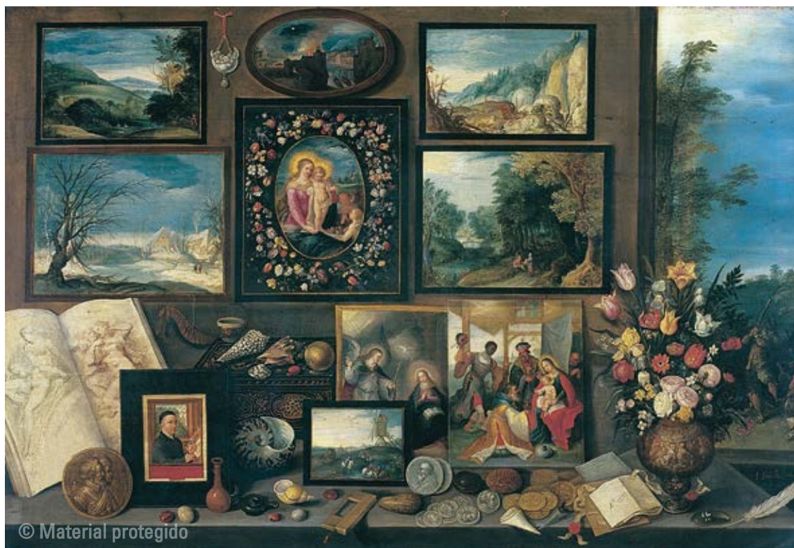
9. Frans Francken II (1581-1642) El gabinete del coleccionista , 1619 Óleo sobre tabla. 56 x 85 cm Koninklijk Museum voor Schone Kunsten, Amberes N.º inv. 816