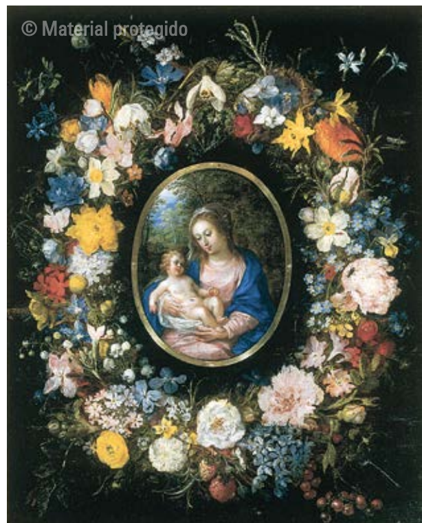
6. Jan Brueghel el Viejo (1568-1625); seguidor de Hendrik van Balen (1575-1632) La Virgen con el Niño en una guirnalda de flores , c. 1608 Óleo sobre cobre. 27 x 22 cm Biblioteca Ambrosiana, Milán