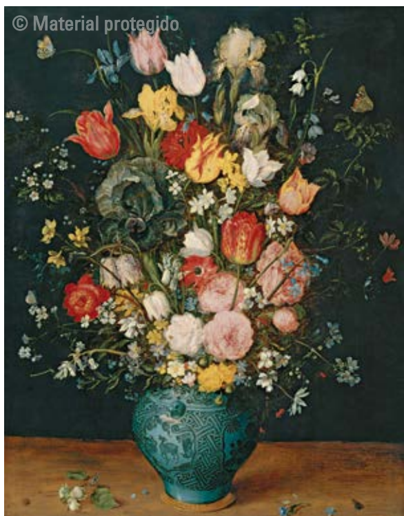
10. Jan Brueghel el Viejo (1568-1625) Ramo de flores en un jarrón azul , c. 1609 Óleo sobre tabla. 66 x 50,5 cm Kunsthistorisches Museum, Gemäldegalerie, Viena N.º inv. GG 558